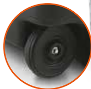
Ejes de ruedas metálicos, ruedas macizas de caucho