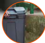
Aptos para usar a la intemperie