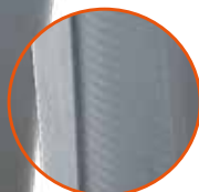
Aditivo con protección UV